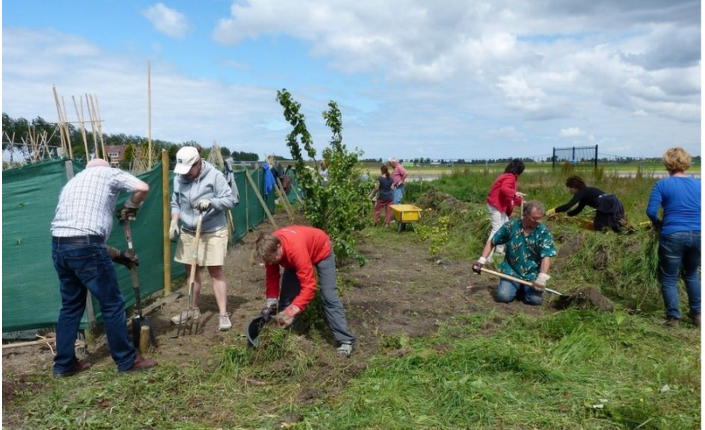
Tudorparkwerk groep april 2014